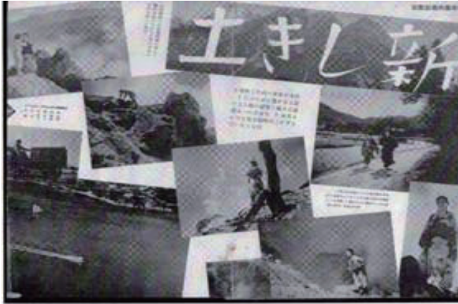
映画雑誌に掲載された『新しき土』の宣伝広告